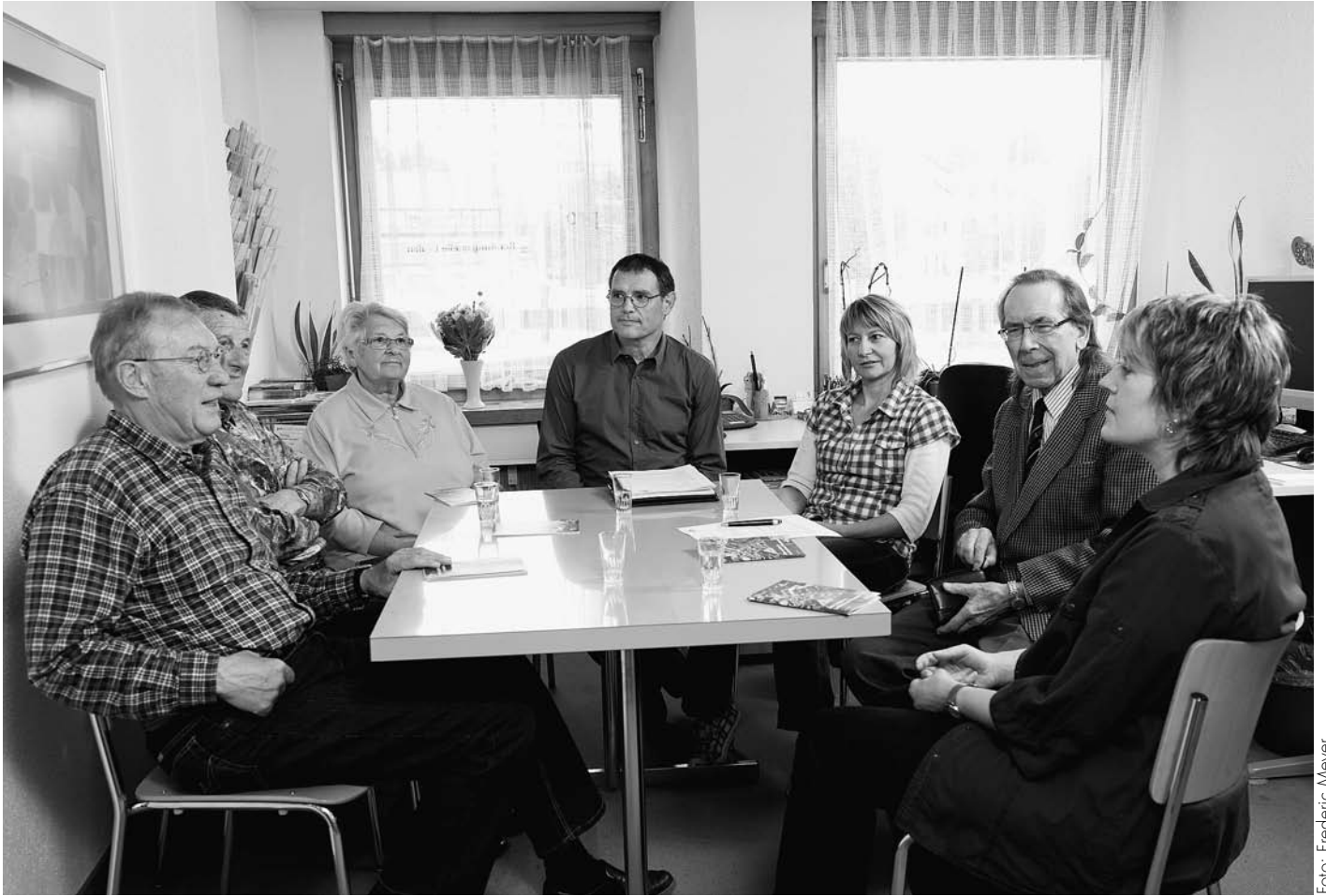
Ältere Menschen wollen nicht ins Abseits gestellt werden, sondern Teil der Gesellschaft sein und bleiben.

haben, die ein reduzierter Sozialstaat hinterlässt?